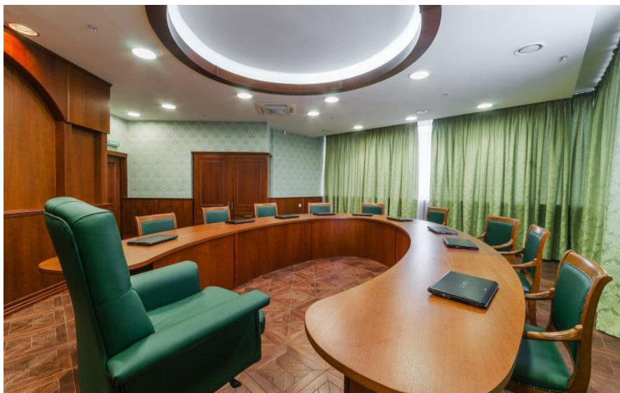
Аудитория для проведения семинарских занятий по теоретическим дисциплинам

Учебные аудитории и помещения «Высшей школы сценических искусств», расположенные по адресу: г. Москва, ул. Шереметьевская д. 6, корп. 2, позволяют проводить все виды учебных занятий по дисциплинам, предусмотренным учебным планом по направлению подготовки «Технология художественного оформления спектакля».