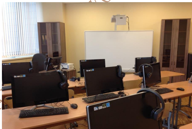
Кабинет иностранного языка (лингфонный)