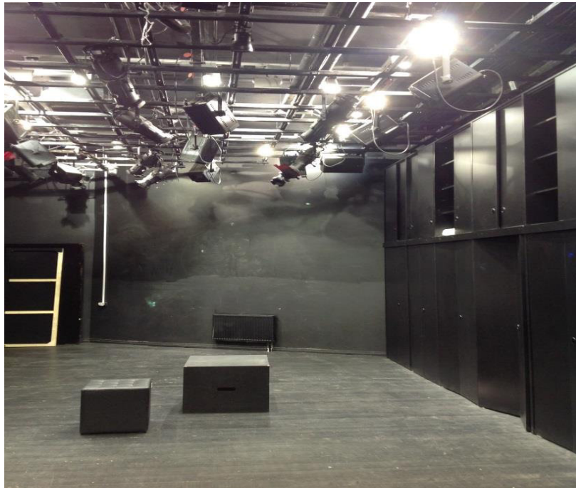
Аудитория актёрского мастерства и режиссуры